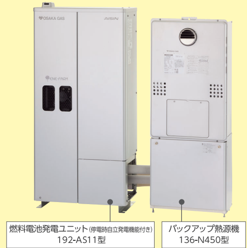
燃料電池発電ユニット (停電時自立発電機能付き) 192-AS11型