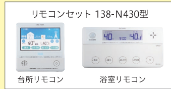
リモコンセット 138-N430型